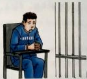
违纪与违法之间仅一步之遥