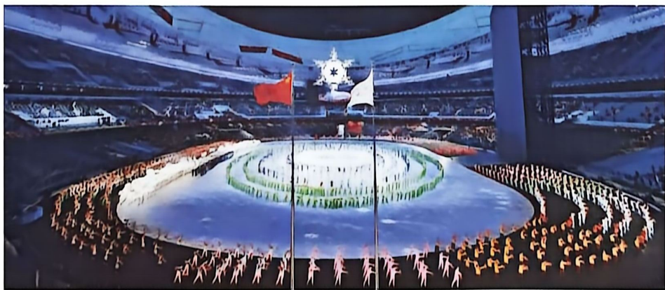
▲ 2022年2月4日,第24届冬季奥林匹克运动会开幕式在北京国家体育场举行

2022年2月至3月,中国成功举办第24届冬季奥林匹克运动会和第13届冬季残疾人奥林匹克运动会,为世界奥林匹克运动的发展作出历史性贡献。