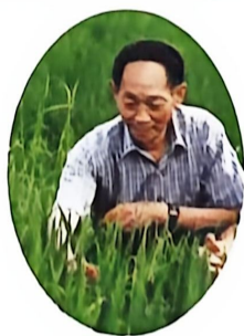
▲ 袁隆平 (1930—2021)

袁隆平，江西德安人。中国工程院院士，中国杂交水稻事业的开创者和领导者，被誉为“杂交水稻之父”。1953年，袁隆平毕业于西南农学院。20世纪70年代中期，他研发出“三系法”籼型杂交水稻并在生产中大规模应用，实现了杂交水稻的历史性突破。此后，他先后成功研究出“两系法”杂交水稻，创建了领先世界的超级杂交稻技术体系，将水稻亩产量提高至1100公斤，为我国粮食安全、农业科学发展和世界粮食供给作出巨大贡献。2000年获得国家最高科学技术奖，2013年获得第四届中国消除贫困奖终身成就奖，2018年被授予“改革先锋”荣誉称号，2019年获颁“共和国勋章”。