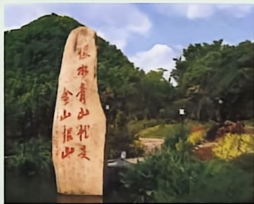
▲ 浙江安吉余村的“绿水青山就是金山银山”石刻

我国坚持“绿水青山就是金山银山”的理念，坚持山水林田湖草沙一体化保护和系统治理，全方位、全地域、全过程加强生态环境保护，深入实施大气、水、土壤污染防治三大行动计划，打好蓝天、碧水、净土保卫战，积极稳妥推进碳达峰碳中和。推进绿色发展、循环发展、低碳发展，坚持走生产发展、生活富裕、生态良好的文明发展道路。