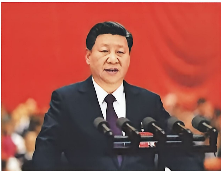
▲ 习近平在中共十九大上作报告

2017年10月18日至24日，中国共产党第十九次全国代表大会在北京召开。习近平作题为《决胜全面建成小康社会，夺取新时代中国特色社会主义伟大胜利》的报告。大会的主题是：不忘初心，牢记使命，高举中国特色社会主义伟大旗帜，决胜全面建成小康社会，夺取新时代中国特色社会主义