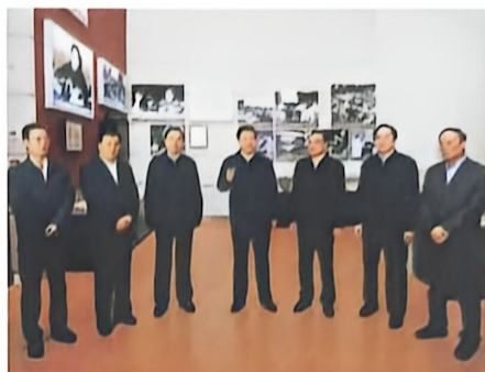
▲ 中共中央总书记习近平和十八届中央政治局常委参观《复兴之路》展览

2012年11月29日，习近平在参观《复兴之路》展览时指出，实现中华民族伟大复兴，就是中华民族近代以来最伟大的梦想。2013年3月17日，习近平在十二届全国人大一次会议上阐明中国梦的本质：实现中华民族伟大复兴的中国梦，就是要实现国家富强、民族振兴、人民幸福。