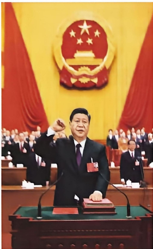
▲ 2018年3月17日，国家主席习近平在十三届全国人大一次会议第五次全体会议上进行宪法宣誓