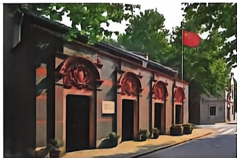
▲ 中国共产党第一次全国代表大会会址 位于上海望志路106号，现为兴业路76号。