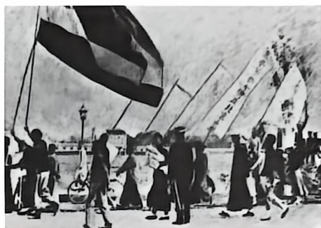
▲ 1919年5月4日北京学生的游行队伍

1919年5月2日，中国在巴黎和会上外交失败的消息传回国内，《晨报》刊文：“胶州亡矣！山东亡矣！国不国矣！”“国亡无日，愿合我四万万众誓死图之。”5月3日晚，北京大学和北京高等师范学校等校的学生积极分子分别举行会议，决定第二天举行示威游行，由此发动了震惊中外的伟大爱国运动。