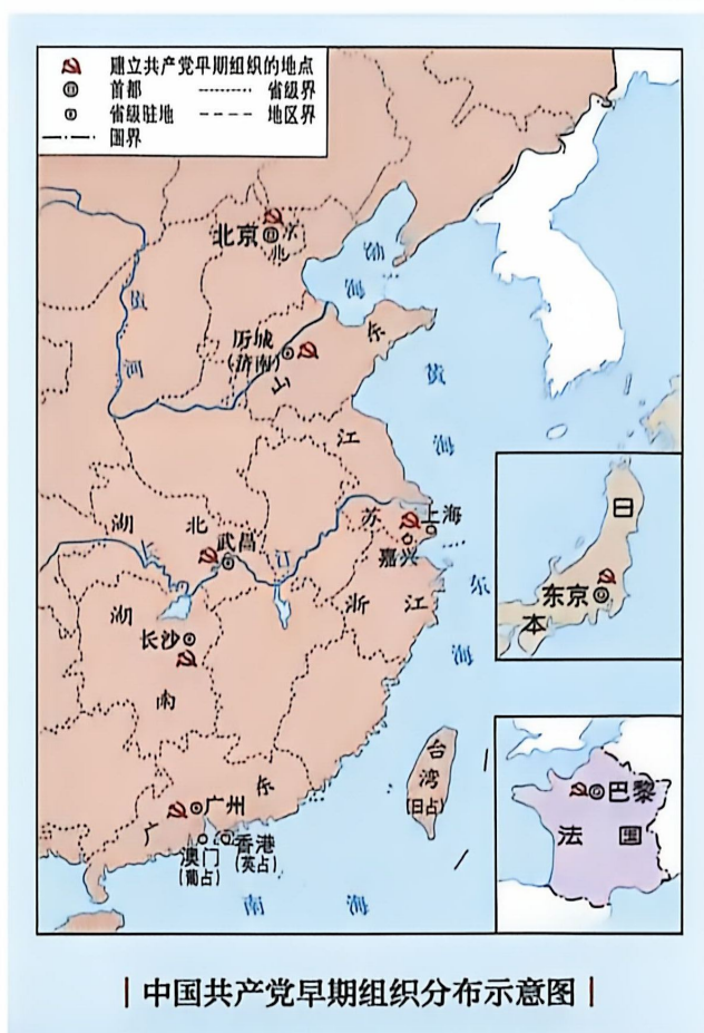
中国共产党早期组织分布示意图

1921年7月23日，中国共产党第一次全国代表大会在上海法租界秘密召开。参加会议的代表有：上海的李达、李汉俊，北京的张国焘、刘仁静，长沙的毛泽东、何叔衡，武汉的董必武、陈潭秋，济南的王尽美、邓恩铭，广州的陈公博，旅日