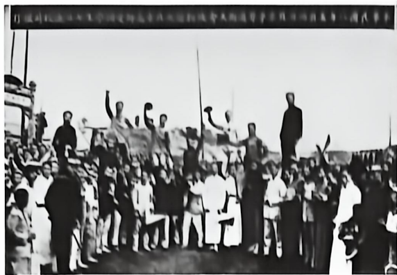
▲ 1919年5月7日北京高师被捕学生回校时受到热烈欢迎