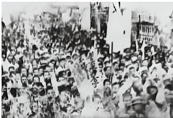
▲ 1919年6月，上海工人举行大罢工要求北洋军阀政府拒绝在巴黎和约上签字

6月3日，北京学生在街头演讲时被北洋军阀政府逮捕178人。消息传到上海，上海工人举行罢工声援，中国工人阶级开始以独立的姿态登上政治舞台，成为爱国运动的主力。运动中心也由北京转移到上海。随后，全国20多个省区、100多个城市出现罢课、罢工、罢市的“三罢”高潮。北京政府被迫释放被捕学生，罢免曹汝霖、章宗祥、陆宗輿的职务，参加巴黎和会的中国代表拒绝在和约上签字。