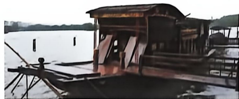
▲ 浙江嘉兴南湖的游船（复制品） 中国共产党第一次全国代表大会在南湖游船上闭幕。

的周佛海； ① 包惠僧受陈独秀派遣，出席了会议。他们代表着全国50多名党员。共产国际代表马林、尼克尔斯基也出席了会议。由于会场受到暗探注意和法租界巡捕搜查，最后一天的会议转移至浙江嘉兴南湖的一艘游船上举行。大会确定党的名称为中国共产党，通过了中国共产党的第一个纲领，明确主张“革命军队必须与无产阶级一起推翻资本家阶级的政权”，“消灭资本家私有制”等。会上决定成立中央局作为中央的临时领导机构，选举陈独秀为中央局书记。